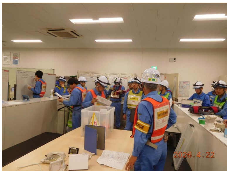
非常対策本部の様子